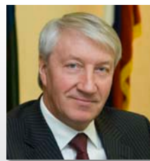
Александр Леонидович СИДОРОВ, глава города Сургут

Родился 15 марта 1952 г. в Ханты-Мансийске.